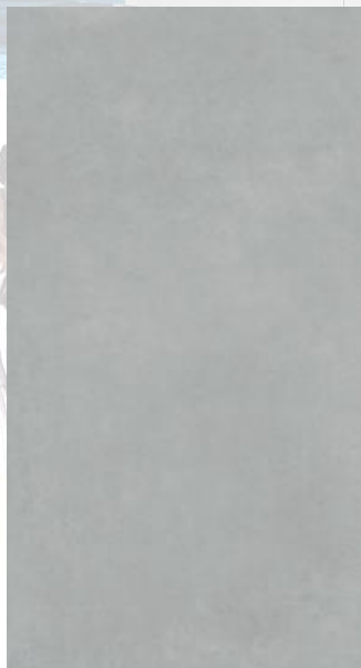
Gravel Grey 60x120 mate