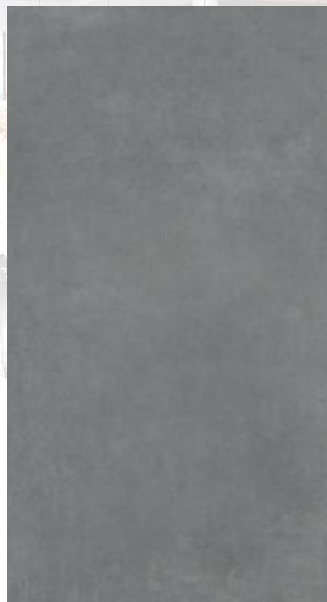
Gravel Shadow 60x120 mate